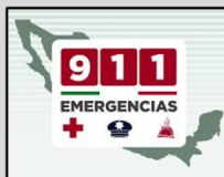
En caso de emergencia marca al 911