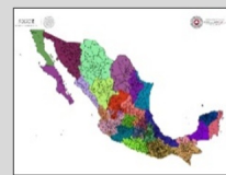
REGIONALIZACIÓN División de tu estado

Validez del boletín: domingo, 24 de octubre de 2021 / 05:00 h