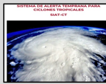
Enlace Manual SIAT-CT SINAPROC