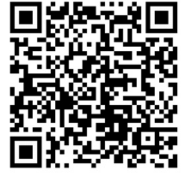
Infografía CENAPRED: "Qué hacer en caso de inundación"