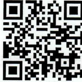
Portal Firma Electrónica ASF

No obstante, se hace de su conocimiento que también podrá ingresar a la plataforma del SiCAF con la e.firma que emite el Servicio de Administración Tributaria.