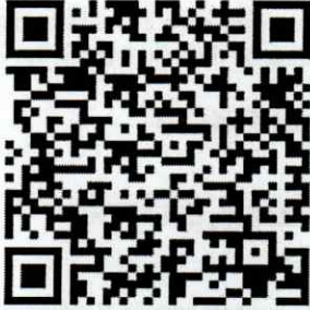
Normatividad Firma Electrónica ASF

DIRECCIÓN GENERAL DE AUDITORÍA DEL GASTO FEDERALIZADO "C"